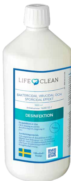
LifeClean Desinfeksjon til overflater og utstyr LifeClean 1L

– LifeClean har fokus på forskning og videreutvikling med miljø som en sterk verdidriver. Produktet har overlegen effekt og er et utrolig godt valg for aktører i sjømatnæringen som ønsker effektiv, trygg og miljøvennlig desinfeksjon av alle flater. LifeClean tar også del i FNs bærekraftsmål om å bekjempe klimaforandringer, avslutter Setterberg.