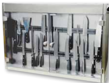
For sikker oppbevaring. Knivskap med mulighet til desinfeksjon. Skapet er laget av rustfritt stål.