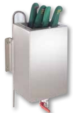
Knivsterilisator i rustfritt stål.