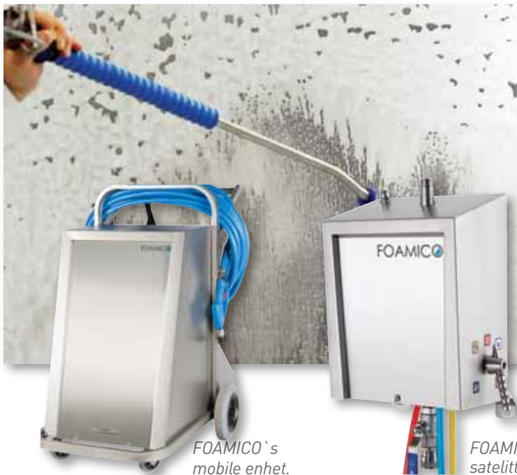
FOAMICO`s mobile enhet.

– enkelt å betjene, robust og driftsikkert