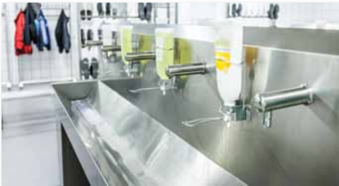
Håndvask i rustfritt stål.