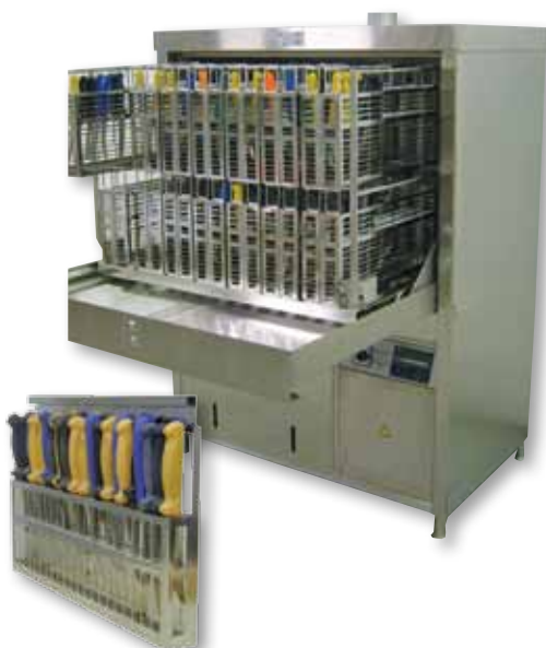
Pesutekno vaskemaskin for kniver, hansker, maskindeler og annet utstyr.

Vi har systemer for effektiv og sikker rengjøring, sterilisering og oppbevaring.