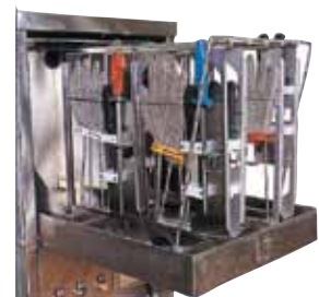
Vask av kniver og vernehansker