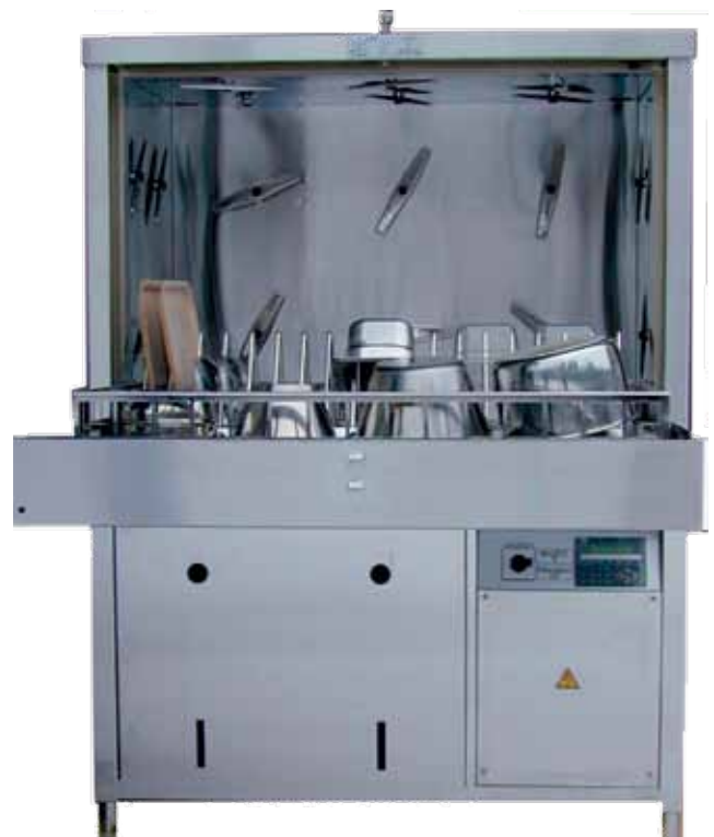
Rengjøring av maskindeler og annet utstyr