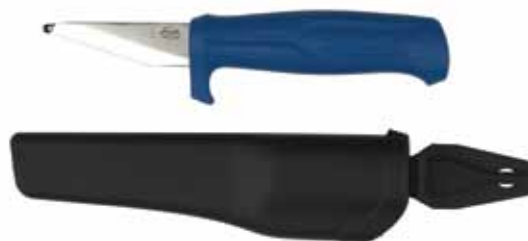
Bløder/rogkniv m/kule 5 cm m/plast slire