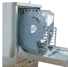
Vask av sliceblad