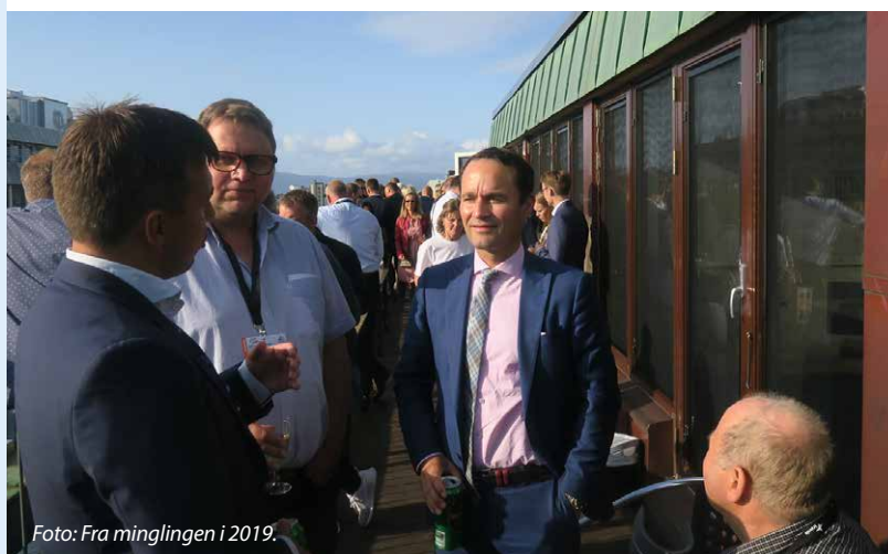
Foto: Fra minglingen i 2019.