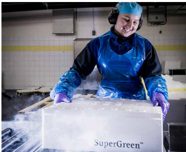
SuperGreen™ er superkjøling med tørris (CO 2 ), der vann-is erstattes for å holde temperaturen nær frysepunktet i opptil 72 timer under transport.

Kravene til kvalitet, holdbarhet og bærekraft i sjømatnæringen øker. Stadig flere produsenter ser derfor etter løsninger som både sikrer optimal kjølekjede og reduserer unødige kostnader og miljøavtrykk. SuperGreen-konseptet fra Nippon Gases Norge er utviklet nettopp med dette som utgangspunkt.